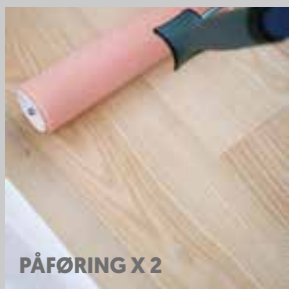
PÅFØRING X 2