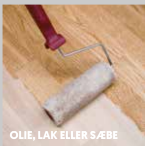
OLIE, LAK ELLER SÆBE