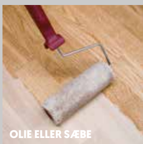
OLIE ELLER SÆBE